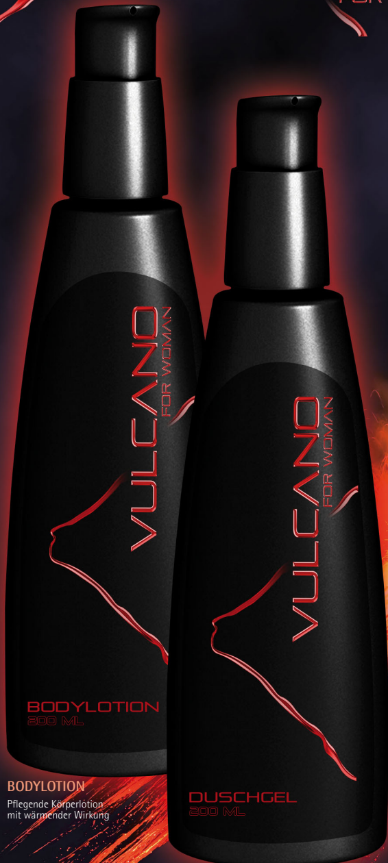
BODYLOTION Pflegende Körperlotion mit wärmender Wirkung