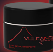
24h-GESICHTSCREME Verstärkter Schutz gegen Sonne, schnell & rückstandsfrei einziehend