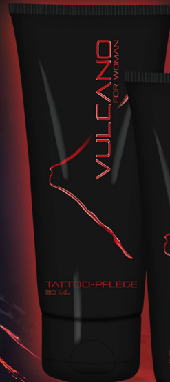
TATTOO-PFLEGE Zur Pflege frisch gestochener und bestehender Tattoos