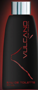
EAU DE TOILETTE Erfrischend