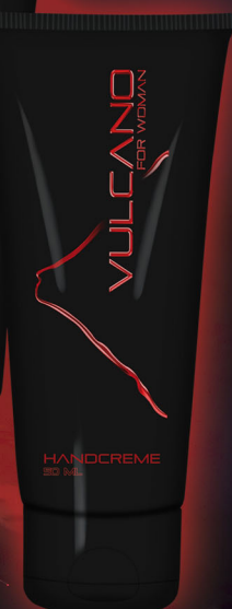
HANDCREME Verstärkter Schutz gegen Sonne, schnell & rückstandsfrei einziehend