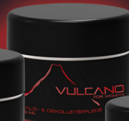
HALS- & DEKOLLETÉPFLEGE Pflegende Creme mit Soforteffekt