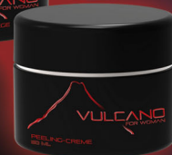
PEELING CREME Anregendes Körperpeeling zur Entfer- nung abgestorbener Hautschüppchen